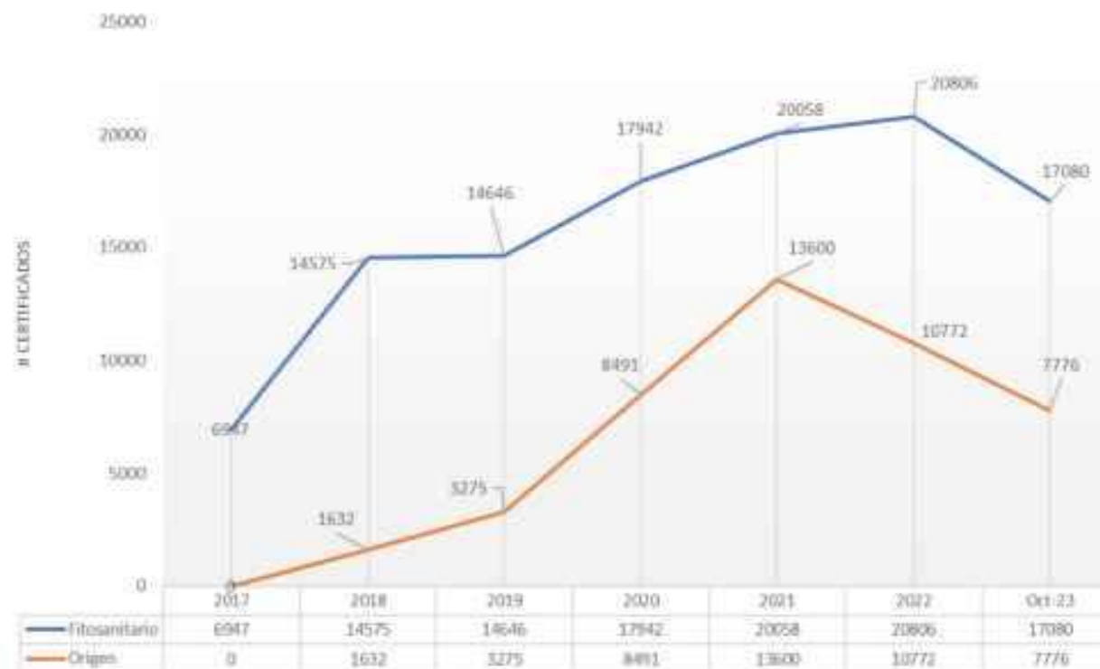
Fitosanitario / Origen